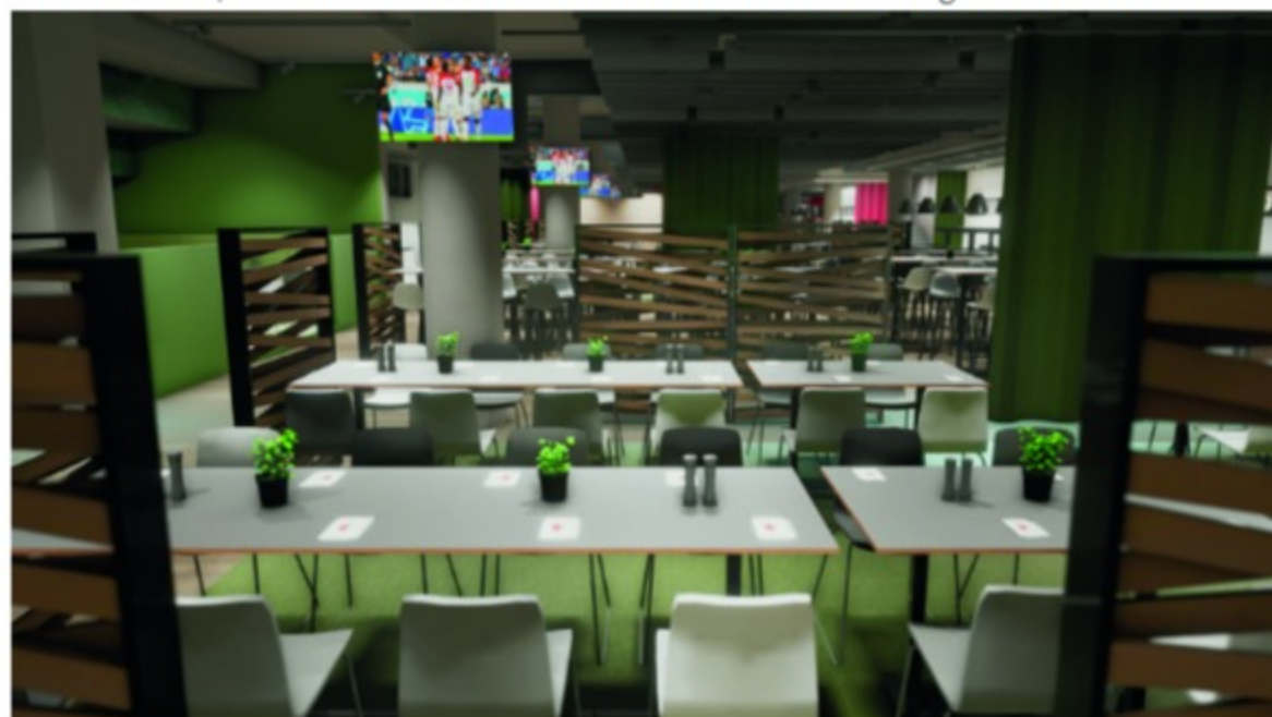
Mit der Virtual Reality Brille können die Gäste einen Blick in die geplante VIP Lounge werfen.